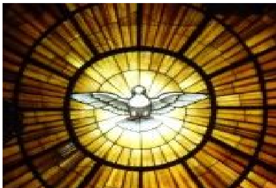
Paroisse Saint-Jean-Paul II

Source : https://eglise.catholique.fr/approfondir-sa-foi/la-celebration-de-la-foi/les-grandes-fetes-chretiennes/la-pentecote/438385-prieres-pour-la-pentecote/